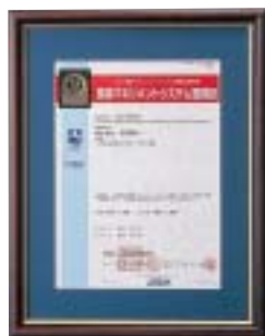
環境マネジメントシステム登録証