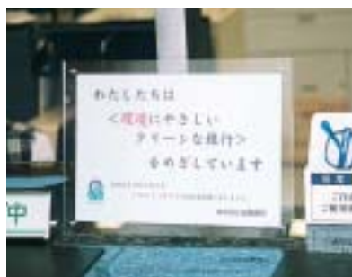
本店営業部のカウンターに掲示した指針