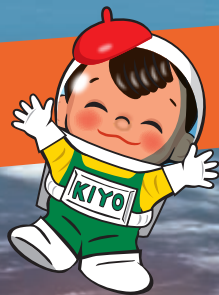
紀陽銀行 公式キャラクター キヨー坊や®