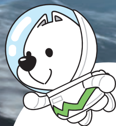
和歌山県PRキャラクター 「きいちゃん」