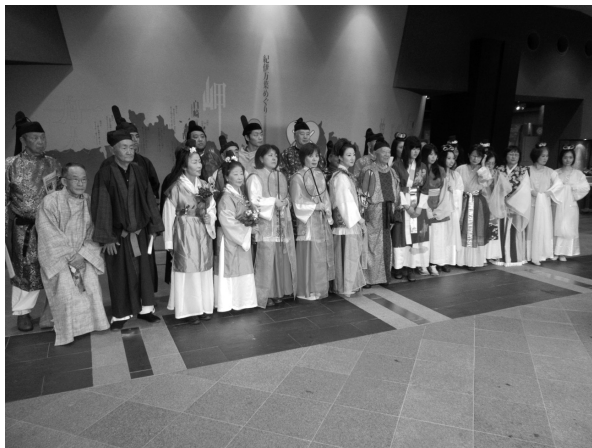
万葉衣装を着ての集合記念写真

万葉集の素晴らしさ、その万葉集に詠われた紀の国の素晴らしさを多くの人と感動を共にしたい、お互いに万葉集のことをもっと知りたい、と今後も地道に活動を続けていきます。「令和」で脚光を浴びた万葉集のブームが一過性で終わらぬことを願いながら。