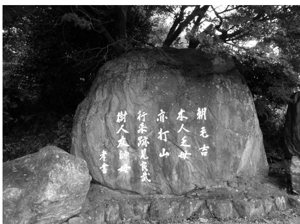
橋本市真土の万葉歌碑 (犬養孝揮毫)

○白たへに にほふ真土の やまかわ 山川に 我が馬 なづむ 家恋ふらしも (巻 7-1192)