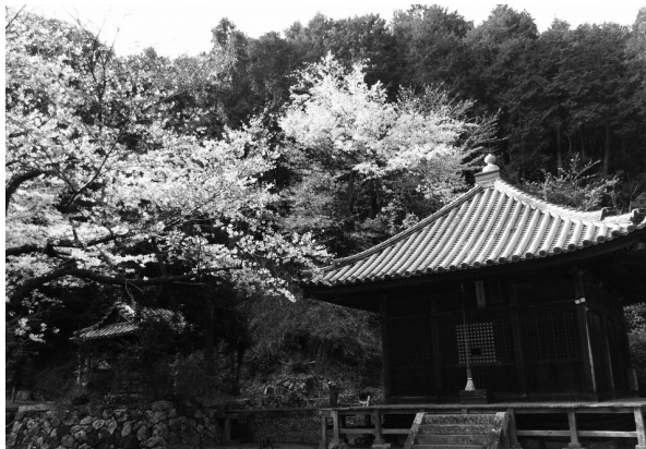
施無畏寺 (栖原海岸) の桜

(口訳) み熊野の浜の浜木綿のように幾重 にも恋しているのに直接は逢えないことだ なあ