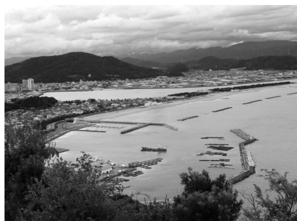
和歌の浦・片男波 (高津子山からの景観)

(口訳) 和歌の浦に潮が満ちてくると 干潟が無くなるので 葦の生えている辺りを目指して 鶴が鳴いて渡っていくことだよ