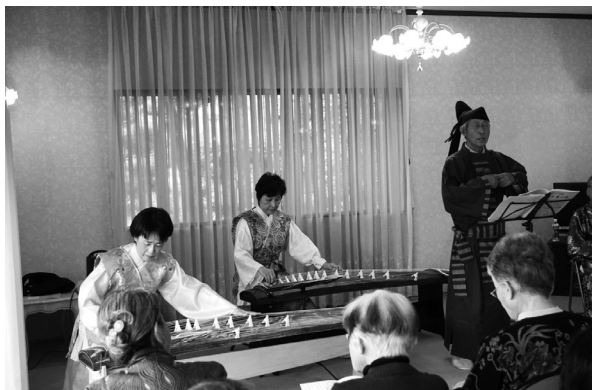
万葉集で楽しむ和の音楽

昨年はさらに、万葉集にも関係ある箏の話題を中心に、箏や尺八の演奏に、万葉歌などの朗誦・歌唱を加え、「万葉集で楽しむ和の音楽」と題する音楽会を催し好評でした。