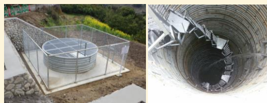
地すべり対策工事