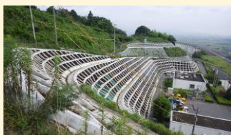
斜面安定・保護対策工事