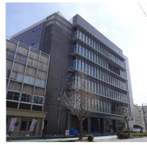
【研修センタービル】