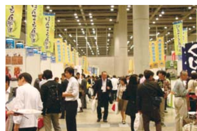
地方銀行フードセレクション 2013