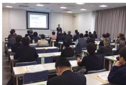
事業承継セミナー