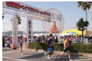
和歌浦ベイマラソン with ジャズ

紀陽銀行は、「和歌山県綱引選手権大会」や少年野球大会、卓球大会などに協賛しております。また、「和歌浦ベイマラソンwithジャズ」の運営ボランティア派遣や和歌山市の夏の中心的なイベントの一つである「紀州おどり」への参加など、地域の各種イベントへの参加を通じ、地域の皆さまとの交流を深めております。