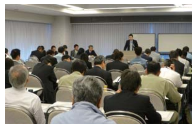
公的補助金活用説明会