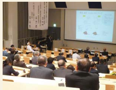
医農連携セミナー