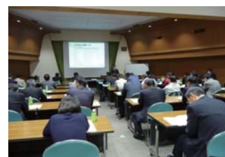
大規模災害対策セミナー

当行の営業エリアである和歌山県・大阪府は「南海トラフ巨大地震」や直下型地震により甚大な被害が予想されている地域であり、本格的な災害対策が急務とされております。平成26年3月に和歌山・大阪の2会場にて大規模災害対策セミナーを開催し、また、グループ会社である紀陽リース・キャピタルは社内に「和歌山BCM訓練センター(*)」を開設いたしました。富士通総研とパートナー契約を締結し、同社の訓練ノウハウやコンテンツを活用し、取引先のBCP策定支援および評価・見直しによる実効性向上や危機対応人材の育成支援を行っております。