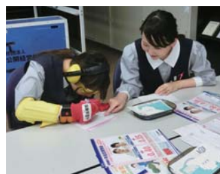
ユニバーサルサービス研修

また、年齢・性別・国籍・障がいの有無にかかわらず、すべてのお客さまに公平なサービスと情報をご提供できるように、「ユニバーサルサービス」の実践研修を行っております。