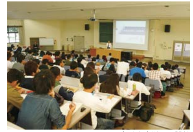
和歌山大学での講義