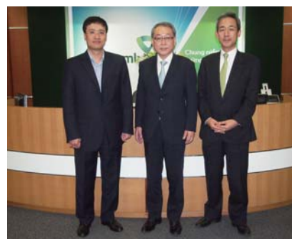
ベトナム銀行との提携