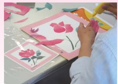
カルチャー教室(ちぎり絵教室)