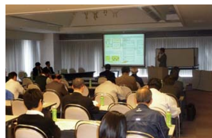
公的支援活用説明会

和歌山県においては、県内の中小企業に新事業への取り組みを助成する公的支援策（元気ファンド、農商工連携ファンド等）の説明会を開催するなど、企業ニーズに合った公的施策の活用支援を行っております。