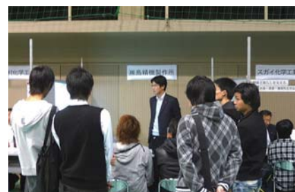
和歌山県内企業合同説明会

こうした地元企業と学校側双方の声をマッチングさせ、地元企業への就職機会の創出と増大につなげることを目的に「企業合同説明会」を開催しております。昨今の就職事情に対応して、学校側からの要請で地元優良企業の採用情報をつなぐお手伝いや個別マッチングも随時行っています。