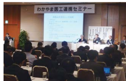
医工連携セミナー

地域経済の活性化と地場産業振興を目的として和歌山大学、和歌山県立医科大学、大阪府立大学、和歌山工業高等専門学校と連携協定を締結しております。また、新規事業への進出サポートのため、和歌山県立医科大学と連携し、年2回「異業種交流会」を開催しております。昨年度は「医工連携」をテーマに、初めて大阪地区でも開催いたしました。