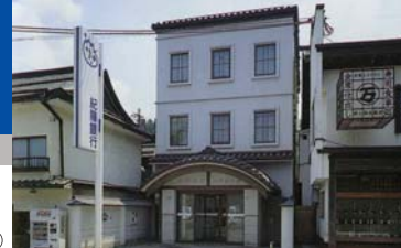
高野山支店（伊都郡）