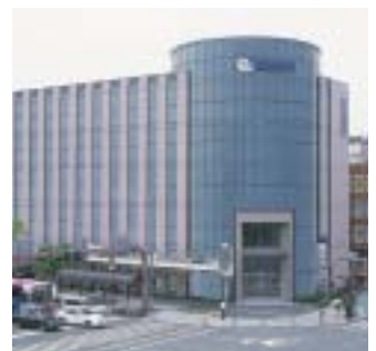
紀陽東和歌山ビル