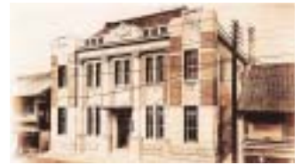
大正8年に新築した本店外観