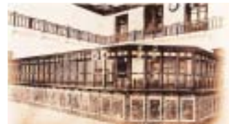
大正8年に新築した本店営業室