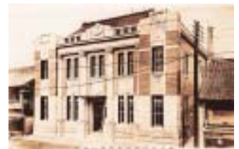
大正8年に新築した本店外観