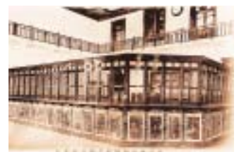
大正8年に新築した本店営業室